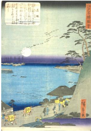
広重 江戸名勝図会高輪