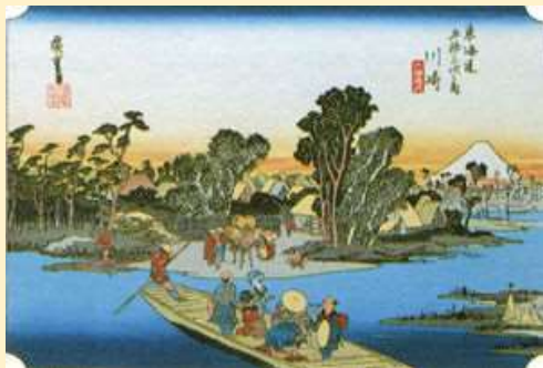
広重「東海道五十三次之内 川崎 六郷渡舟」

今回は源頼朝ゆかりの神社であり、江戸時代には徳川家康からも朱印状を発給されて厚く保護された六郷神社を訪れます。その後、六郷川（多摩川）を渡り、「川崎宿」に入ります。今年、起立400年にあたる「川崎宿」では、旧跡の数々を巡りつつ、かつて東海道の宿場として、また川崎大師への参詣経路として賑わった往時の姿に思いをはせます。