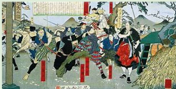
「生麦之発殺」(早川松山画)

今回は、幕末の「生麦事件」にスポットをあてたコースを企画しました。幕末の日本の歴史に大きな影響を与え、尊王攘夷から開国、討幕、明治維新へと日本の近代化へ繋がるターニングポイントとなった大事件でした。生麦の神明公園をスタートとし、通称「踏切寺」にも立ち寄り、神奈川の宿場を歩きます。