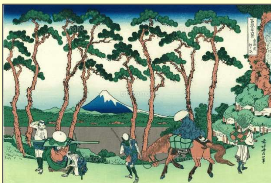
葛飾北斎「富嶽三十六景 東海道 保土ヶ谷」

江戸時代初期、古東海道は、現在の旧古町橋跡から大蓮寺の門前を通っていたと推定されています。今回は、久しぶりに出羽三山講に關係の深い外川神社や庭の美しい樹源寺を訪ねます。保土ヶ谷宿の日常生活や旅人の苦勞に思いを馳せながら保土ヶ谷宿から権太坂を上り品濃の一里塚まで、ガイドと共に歩きませんか。権太坂から素顔の富士山が見えるかもしれません。