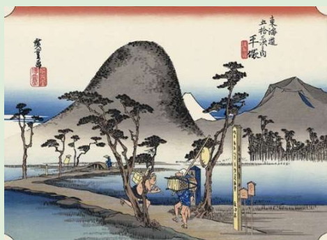
広重「東海道五十三次之内 平塚 繩手道」

日本橋を発って7番目の宿場「平塚宿」は、徳川家の中原御殿から最も近い東海道の宿場として設営されました。東西に真っすぐにのびる東海道に沿って町並みが続いており、西の正面には高麗山が見え、次第に目の前に迫ってきます。この宿場には伝説の女性にゆかりの場所があります。