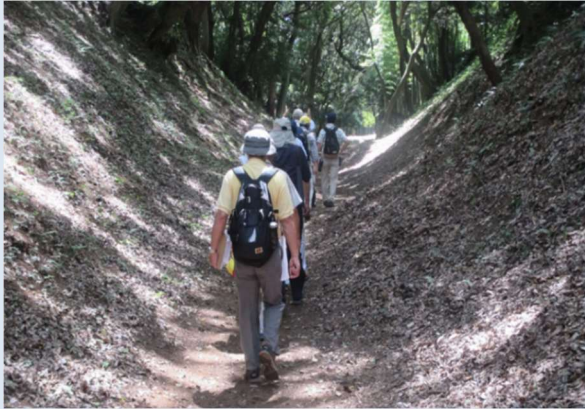
小峯御鐘ノ台大堀切東堀を歩く